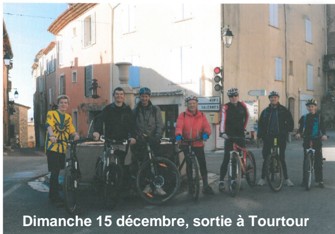
Dimanche 15 décembre, sortie à Tourtour

Le camion « Kebab » interrompt momentanément son activité sur le territoire communal. Il devrait rouvrir dans le courant du mois de Janvier . A confirmer.